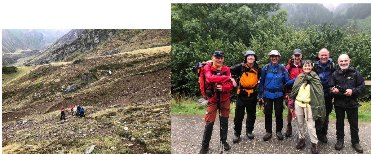
Photo de groupe au parking. Malgré la pluie qui a fait son apparition, tout le monde souriant dans le plus pur esprit STOM ! Collation bien méritée à Arreau.

Quelques hésitations au franchissement de la barre en redescendant, la transversale supérieure s'avérant facile à rater. Tout le monde se retrouve en bas sans encombre.